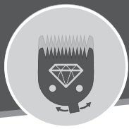
DIAMOND BLADE 0,7 - 3 mm