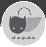
QUICK CHANGE changeable