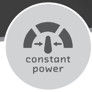
CONSTANT CUTTING POWER constant power