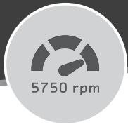
HIGH RPM 5750 rpm