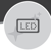
OPTIC INFORMATION SYSTEM