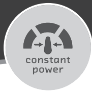
CONSTANT CUTTING POWER