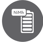
Cordless Operation 1h25 use | 2h charge